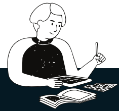
Diagramme de GANTT